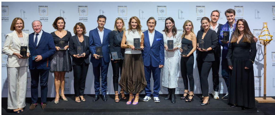
Los ganadores de la XV Edición Premios Academia del Perfume

La Smell News, los ganadores, los vídeos de los jurados y toda la información y contenidos de los Premios está disponible en el microsite que la Academia ha creado ad hoc para este fin.